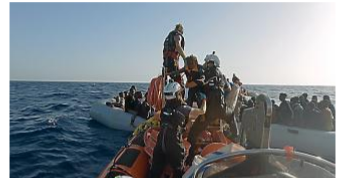
SOS Méditerranée au secours d'exilés en pleine mer.