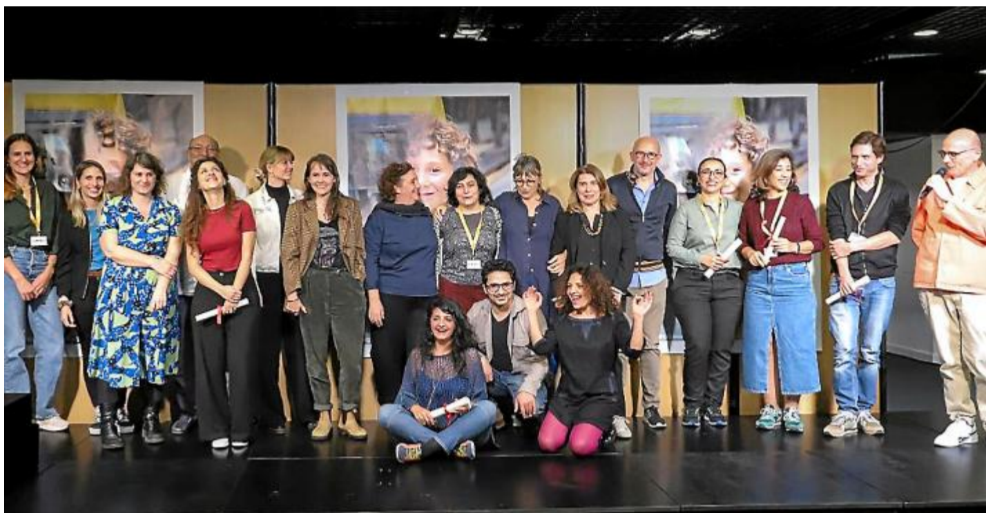
Les lauréats du Cinemed Meetings 2023.

La sélection se réalise sur la base de projets de longs métra-