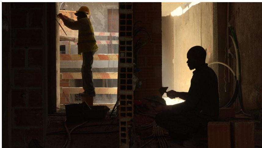
A Morte de uma cidade de João Rosas

Alors qu'une ancienne imprimerie au cœur de Lisbonne est détruite en vue de la construction d'un hôtel de luxe, le réalisateur prend sa caméra et commence à filmer les travailleurs, ces personnes invisibilisées qui travaillent dans l'ombre d'une construction dont ils sont exclus du devenir.